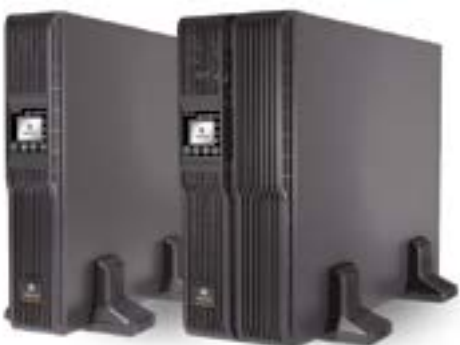
Liebert GXT4 700 - 3000 VA