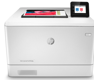
HP Color LaserJet Pro M454dw

Imprimante avec sécurité dynamique activée. Uniquement destinée à être utilisée avec des cartouches dotées d'une puce authentique HP. Les cartouches dotées d'une puce non HP peuvent ne pas fonctionner et celles qui fonctionnent actuellement pourraient ne plus fonctionner à l'avenir. Pour en savoir plus, consultez :