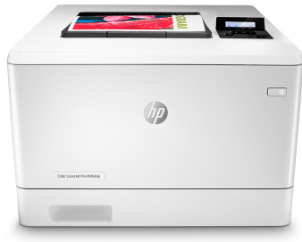
HP Color LaserJet Pro M454dn

Le secret de la réussite d'une entreprise : travailler intelligemment. L'imprimante HP Color LaserJet Pro M454 est conçue pour vous laisser vous consacrer aux tâches assurant la croissance efficace de votre entreprise et vous permettant de rester en tête de la concurrence.